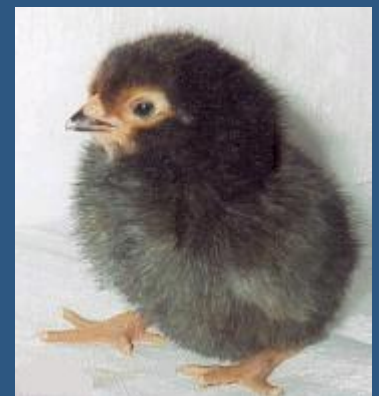
Het Vorwerk kuiken 1 dag oud.

“Voor meer informatie kijk ook op www.lakenvelder- vorwerkclub.nl ”