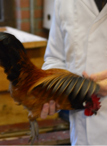
keurmeester aan het werk.