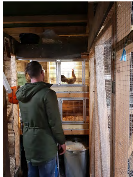
De keurmeester in actie

Na de keuring is er nog gesproken over de hobby, de promotie van de hobby en mogelijkheid voor een hokbezoek.