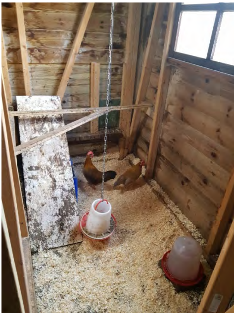
De rennen afgesloten zodat de dieren gemakkelijk te pakken zijn

Doordat de keurmeester aan huis komt kan er breder gesproken worden dan enkel de te keuren dieren. Er is gesproken over de lijn, foktechnische zaken, gezondheid etc. Doordat Rick dit ras en de kleurslagen door en door kent kon er ook heel specifiek over wensen op langere termijn worden gesproken.