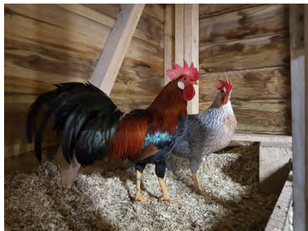
Patrijs goudflitter haan en zilverflitter hen ( geen fokcombi)